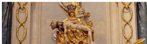
ROK 2014 / ROK SEDEMBOLESTNEJ PANNY MÁRIE www.bazilika.sk FB: Bazilika Sedembolestnej